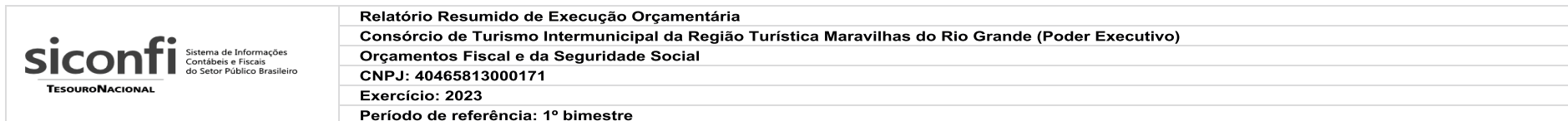
RREO-Anexo 02 | Tabela 2.0 - Demonstrativo da Execução das Despesas por Função/Subfunção | Total das Despesas Exceto Intra-Orçamentárias